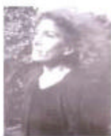
Professora Mireille Delmas-Marty Collège de France